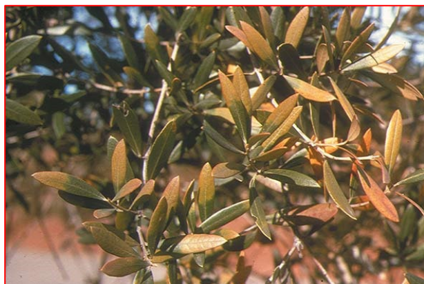
Sintomi di Boro Carenza