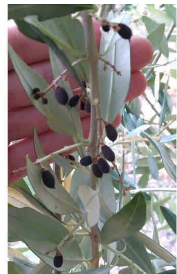
Figura 2_Necrosi completa di un intero rametto fruttifero