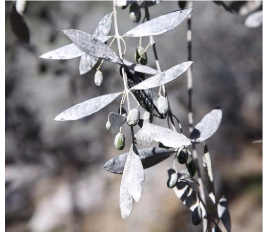
Figura 3: Dettaglio di olivo trattato con caolino.

L'utilizzo durante il corso della stagione varia in funzione dell'area trattata. Di norma i trattamenti con strategie attract and kill funzionano efficacemente se l'areale trattato è superiore ai 3 ettari o nei casi di oliveti isolati. Si riporta alla fine di questo bollettino lo schema di utilizzo per tali prodotti.