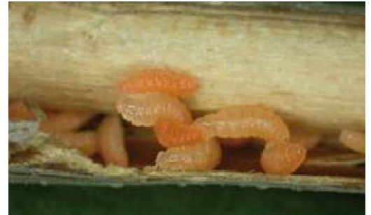
Figura 6: Particolare di larve di moscerino suggiscorza.

L'individuazione delle larve è generalmente da ricercarsi nel rametto di due anni ove vi sono lesioni del legno.