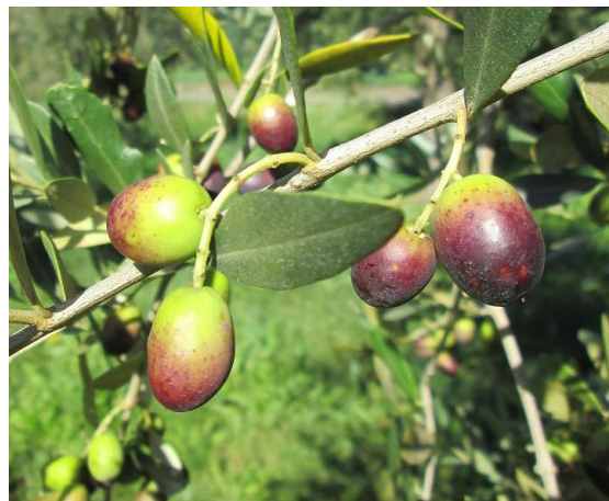
Figura 1: Olive in fase di invaiatura su cv. Leccino nell'areale Gardesano (foto dall'archivio).