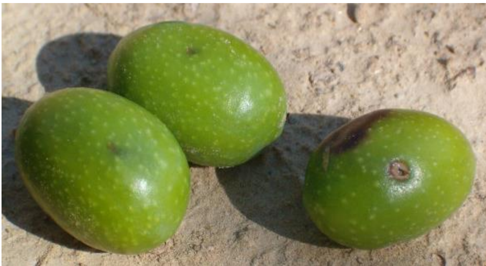
Figura 3: A sx: olive con deposizione di Bactrocera oleae , sezionando l'oliva si possono individuare uova o larve. A dx: oliva con foro di sfarfallamento. In questo caso il ciclo della mosca si è completato e l'oliva è destinata a cadere.

È comunque consigliato procedere con trattamenti adulticidi biologici, per abbattere la popolazione.