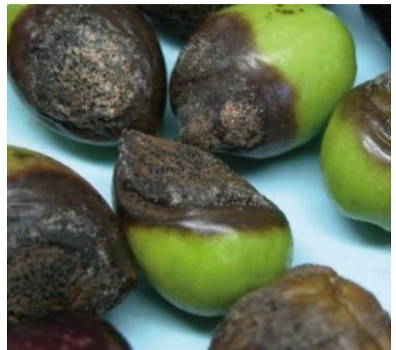
Figura 1: Una possibile manifestazione di lebbra dell'olivo.

In questo periodo è assolutamente vietato l'utilizzo di prodotti sistemici per il contrasto della Lebbra. Questi prodotti infatti possiedono tempi di carenza molto lunghi (es. 120 giorni).