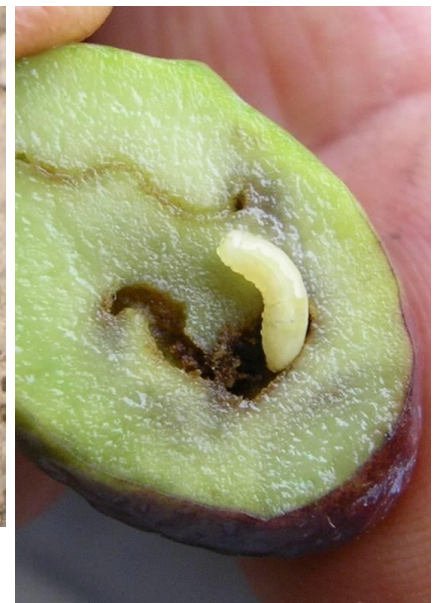
Figura 4: Larva di terza età